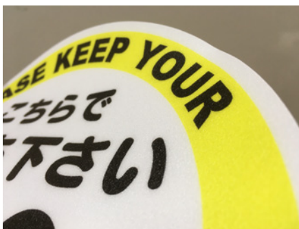
耐久性の高い床用ラミネート加工