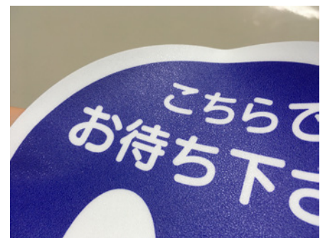
表面はエンボス加工