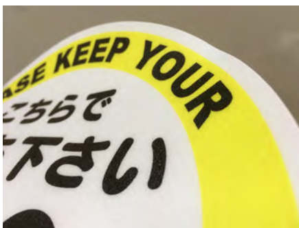
耐久性の高い床用ラミネート加工