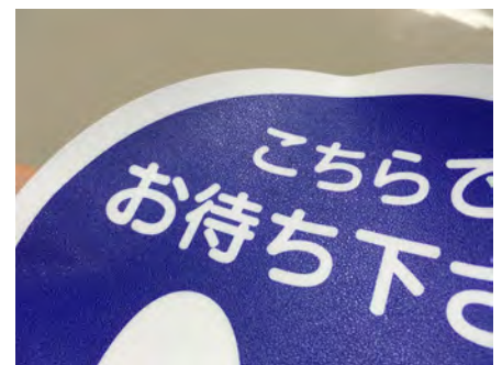
表面はエンボス加工